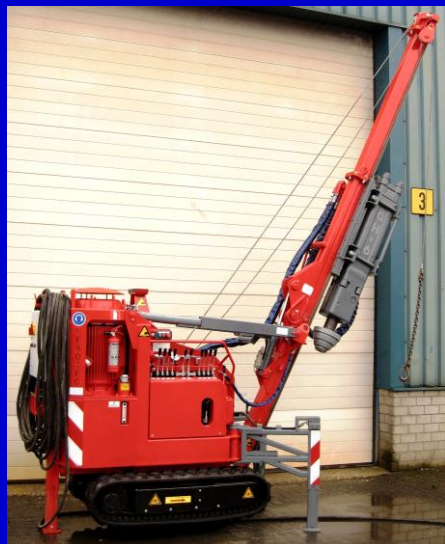
Mini-heier LBT- 2.0 - H